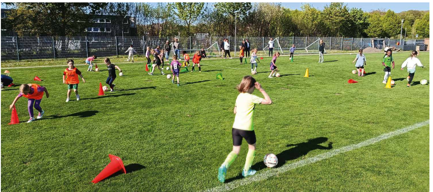
Bewegung war angesagt.