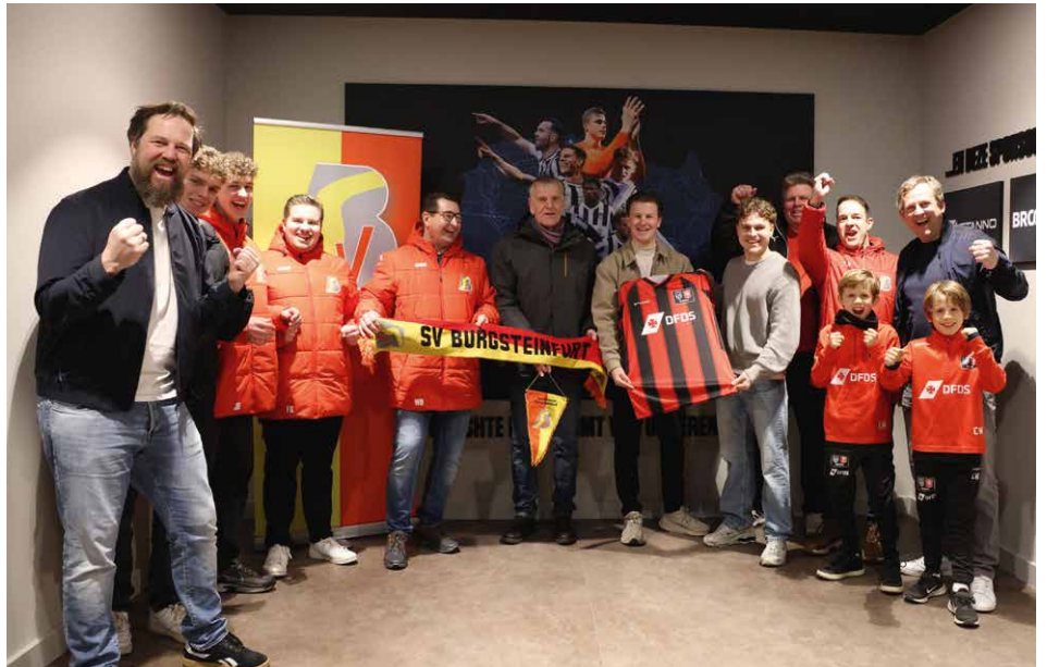
Kooperationsvereinbarung – ein Anlass zu großer Freude.

Herzstück der Kooperation ist der Regioplan, ein starkes Netzwerk für den Nachwuchs. Er sieht eine enge Zusammenarbeit mit ausgewählten Partnervereinen vor, um das Potenzial der regionalen Fußballlandschaft voll auszuschöpfen. Im Mittelpunkt steht dabei immer das Wohl des einzelnen Spielers. Durch gemeinsame Aktivitäten, systematischen Wissensaustausch und einheitliche Förderkonzepte wird ein starkes und wertvolles Netzwerk geschaffen. Ein wesentlicher Pfeiler der Kooperation ist die Fort- und Weiterbildung der Trainer. Der SVB erhält Zugang zu