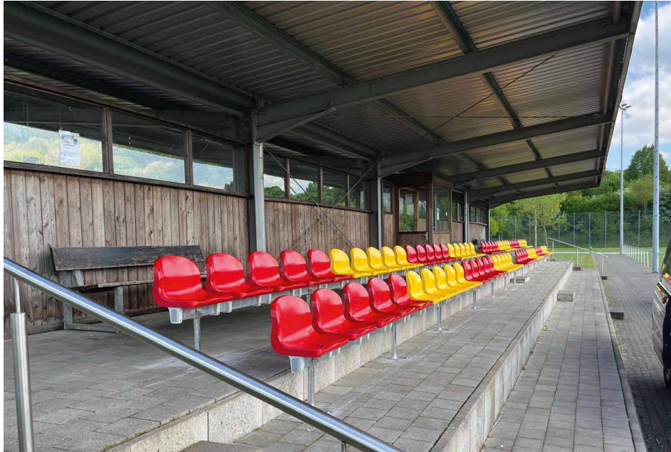
Veränderungen auf der Tribüne: Die Seite zum Kunstrasenfeld bekam neue Sitzschalen, und die vorhandenen Schalen an der zum Rasenfeld weisenden Seite wurden um eine Stufe nach oben neu montiert.

wird der Spielplan mehr Wochentagspiele ausweisen als bisher üblich, nämlich fünf. Bei den Abweichungen vom Rahmenterminplan des FLVW handelt es sich um die beiden ersten