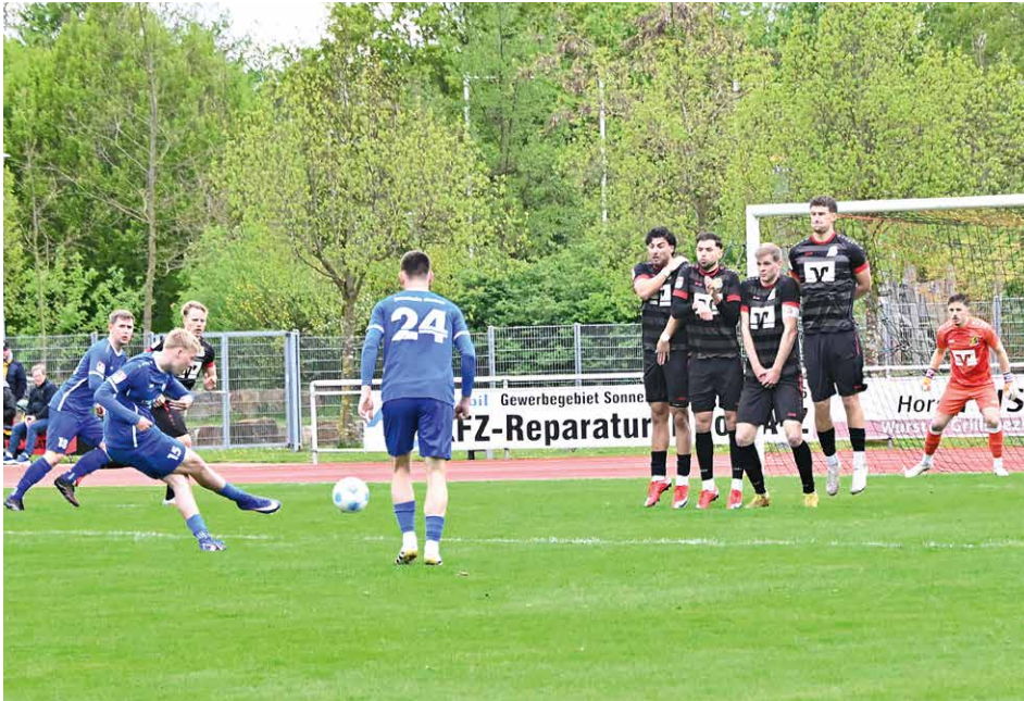
Einen selten spannenden Verlauf nahm am 19. April das Landesligaspiel gegen Westfalia Gemen. Mit 0:2 geriet SVB in einen vermeintlich vorentscheidenden Rückstand.