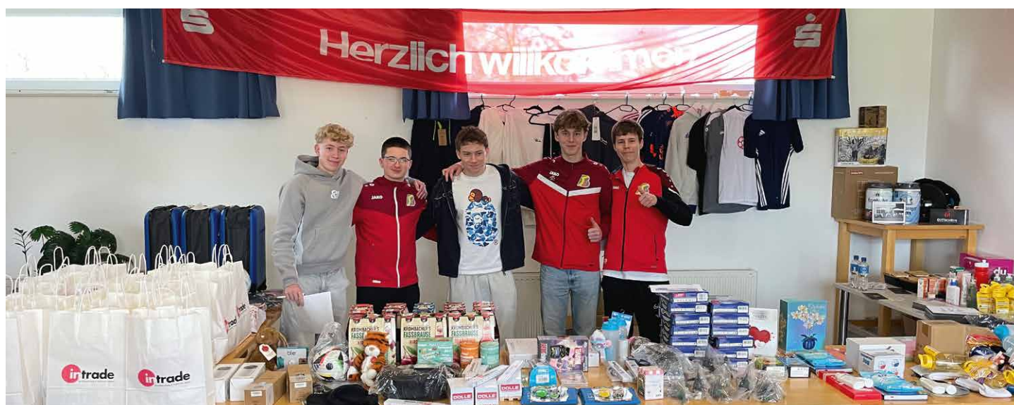
Die von den Jugendlichen organisierte Tombola trug zur Finanzierung der Spanienfahrt 2026 bei.

der Trainer, die Ausbildung der Spieler sowie als dritte Säule die externe Kooperation, wie sie mit der FC Twente/Heracles Academie bereits begonnen hat und in Ausgabe 419 von SVB Aktuell vorgestellt wurde.