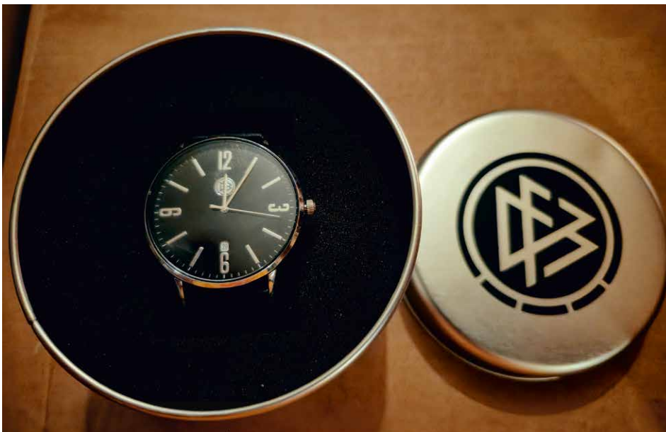
Außer einer Urkunde bekam jeder der kürzlich Geehrten (s. vorige Seiten) eine DFB-Armbanduhr überreicht.

Sie bereichern durch ihre Mitgliedschaft die Jugendabteilung (5) und die Altherrenabteilung (2).